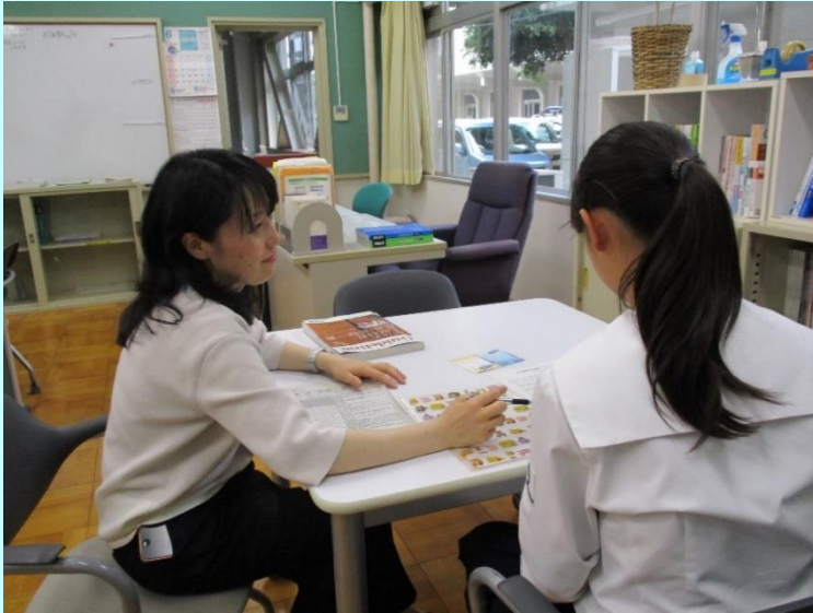
ガイダンスセンター